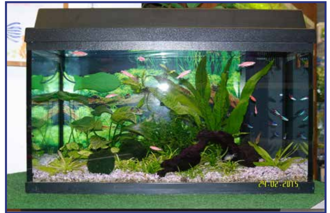
Händler-Aquarium mit Aquarium-Fresher