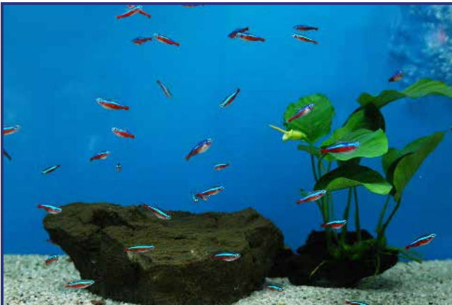
Fachhändler-Aquarium mit Aquarium-Fresher