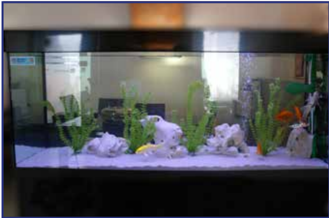
„Büro-Aquarium“ mit Aquarium-Fresher